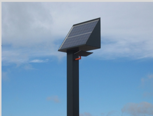
ORION 70W Versión arquitectónica. (Escuela de Ingenieros de Badajoz)

COMPONENTES: ATERSA: PANEL SOLAR, BATERÍAS DE GEL, REGULADOR. INDAL: LUMINARIA STELA. ORBIS: RELOJ ENCENCIDO. LUMINOVA: FUENTE DE ALIMENTACIÓN DE DOBLE NIVEL.