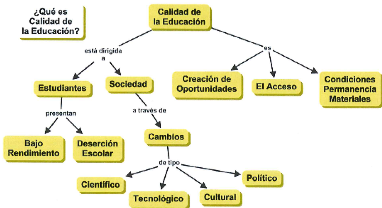
Figura 1. Mapa conceptual con estructura de árbol generado a partir de una pregunta de enfoque estática.

En una serie de estudios, Safayeni, Derbentseva & Cañas (2005) han encontrado que la estructura de los mapas conceptuales puede ser indicativa del nivel de pensamiento expresado en el mapa. Por ejemplo, los mapas conceptuales modelados con una estructura cíclica (ver Figuras 1 y 2) llevan a un mayor número de proposiciones dinámicas o significativas si se comparan con mapas conceptuales modelados con estructuras tipo árbol. En sus trabajos presentados en los Congresos sobre Mapas Conceptuales (Derbentseva, Safayeni & Cañas, 2004, 2006) reportan además sobre experimentos que comparan dos estrategias para promover la construcción de relaciones más dinámicas: el uso de cuantificadores en el concepto raíz de un mapa conceptual y una pregunta de enfoque dinámica. Interesantemente, a pesar de que una pregunta de enfoque más dinámica tiene un efecto sobre la naturaleza de las proposiciones generadas, agregar un "cuantificador" al concepto raíz del mapa tiene un mayor impacto. A pesar de que los resultados de los experimentos son preliminares, recomiendan tres estrategias mediante las cuales se puede fomentar un pensamiento más dinámico: mapas cíclicos, una pregunta de enfoque dinámica, y un concepto raíz cuantificado.