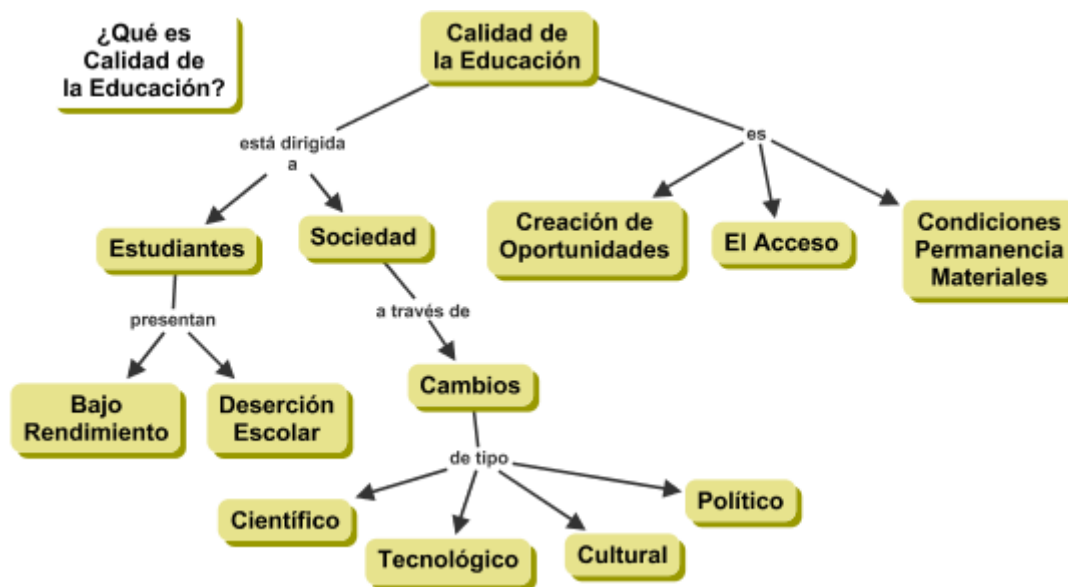
Figura 1. Mapa conceptual con estructura de árbol generado a a partir de una pregunta de enfoque estática.

promover la construcción de relaciones más dinámicas: el uso de cuantificadores en el concepto raíz de un mapa conceptual y una pregunta de enfoque dinámica. Interesantemente, a pesar de que una pregunta de enfoque más dinámica tiene un efecto sobre la naturaleza de las proposiciones generadas, agregar un "cuantificador" al concepto raíz del mapa tiene un mayor impacto. A pesar de que los resultados de los experimentos son preliminares, recomiendan tres estrategias mediante las cuales se puede fomentar un pensamiento más dinámico: mapas cíclicos, una pregunta de enfoque dinámica, y un concepto raíz cuantificado.